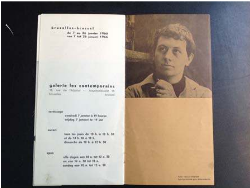
Galleries les Contemporains