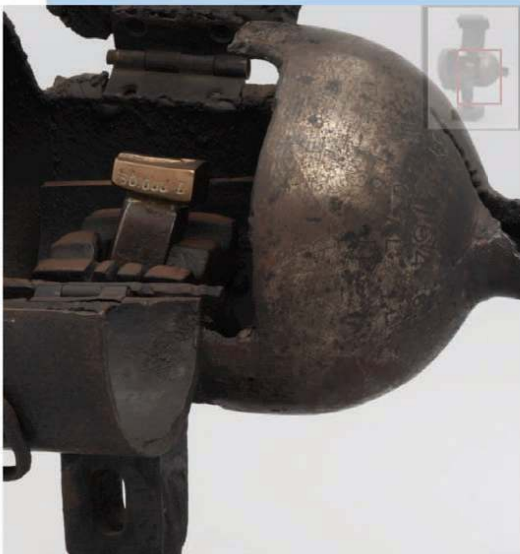
'Hiroshima'beeld in bezit van Middelheim Museum