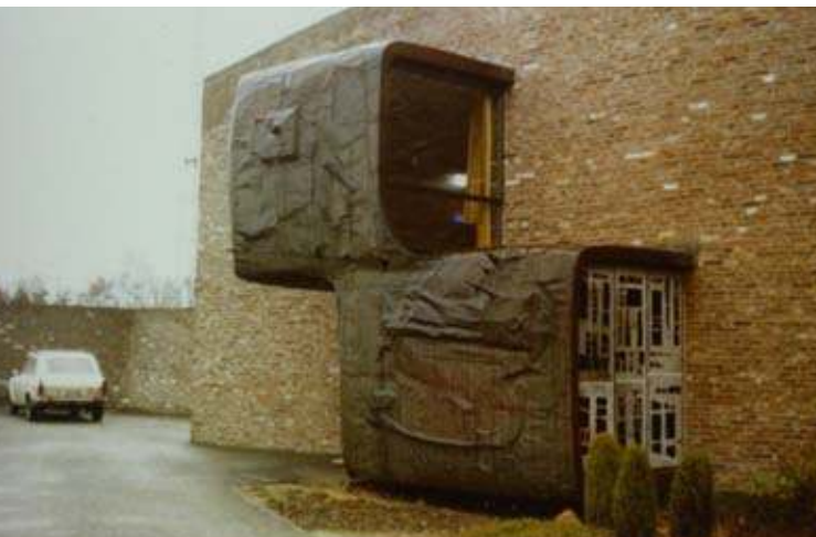
buitenbouw Heusden 1967