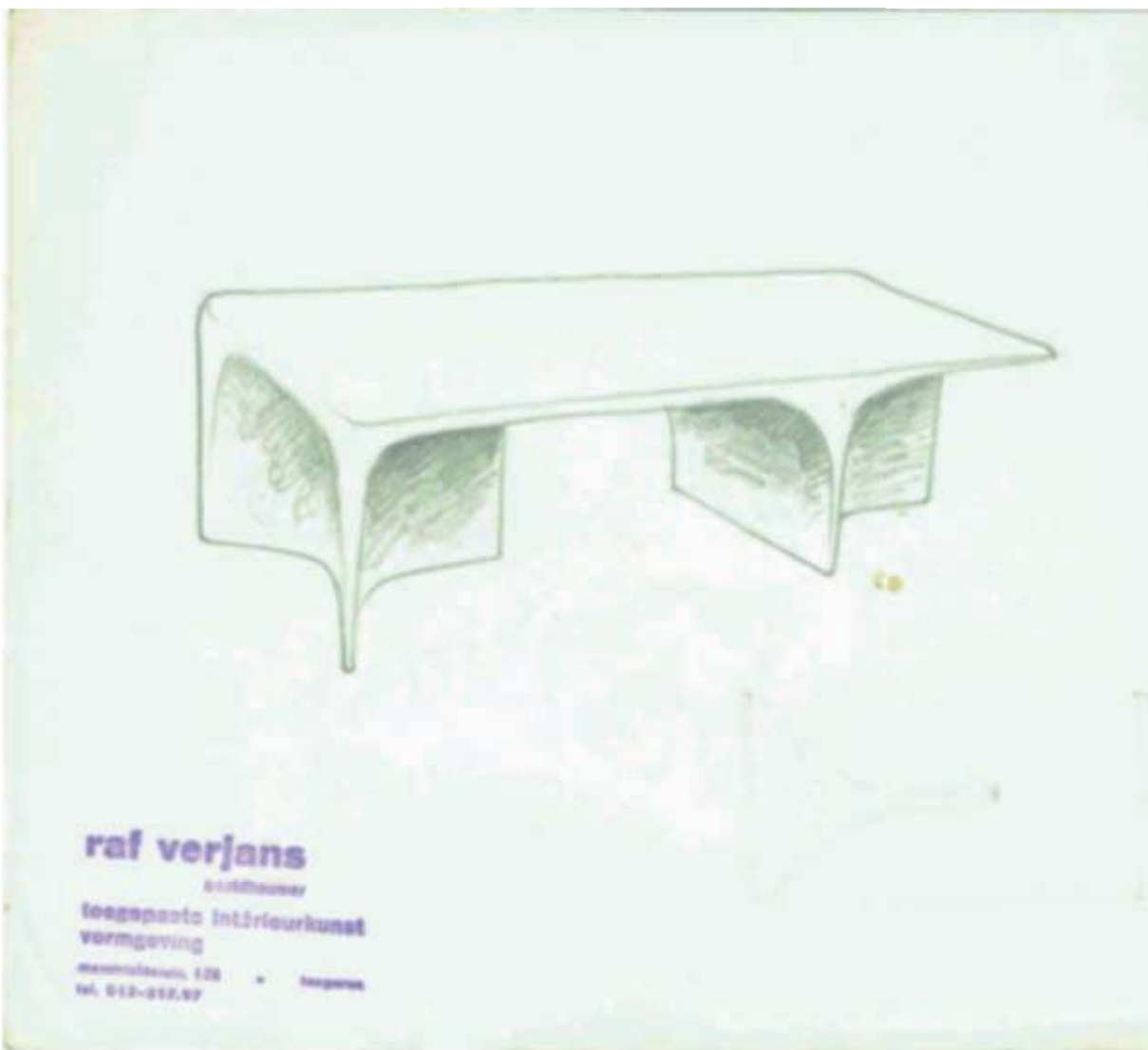
ontwerp schets tafel 1965