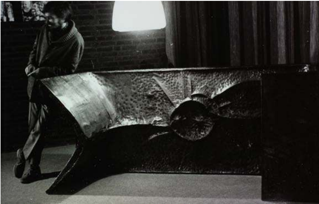
Tafel voor Architect Dewolf 1965