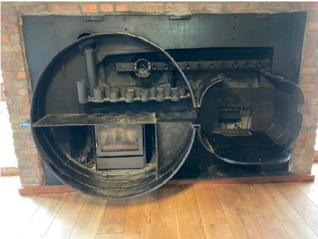
openhaard Tongeren 1969