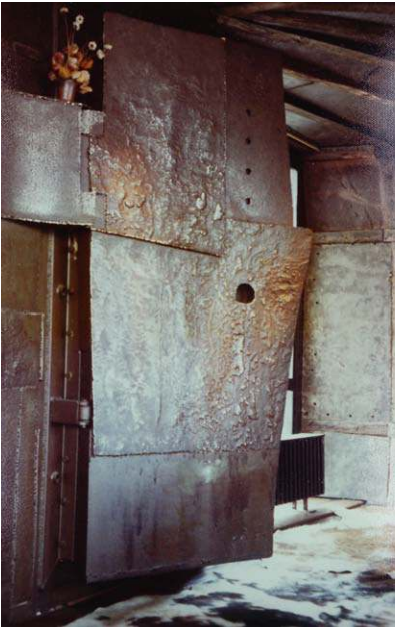
deur-kast openhaard Diepenbeek