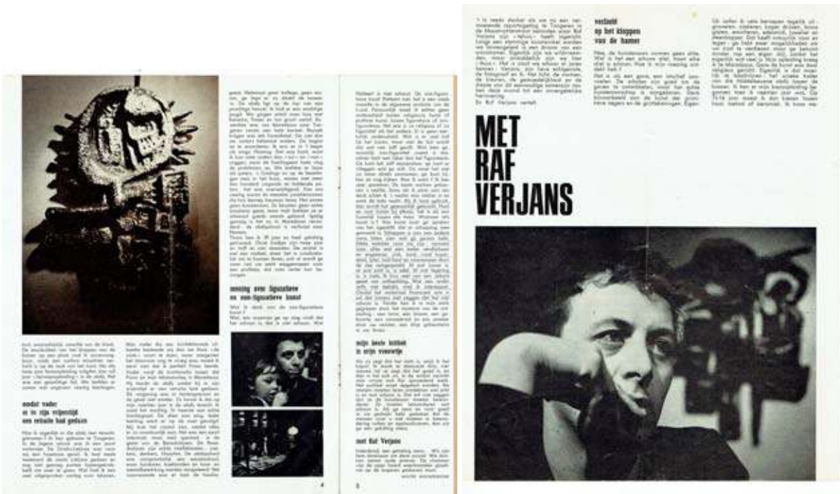
Brussel 1966 (circulaire – schroot sculpturen)